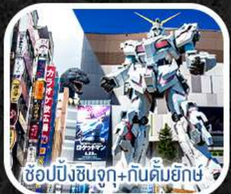
ช้อปปิ้งชินจูกุ + กันดั้มยักษ์