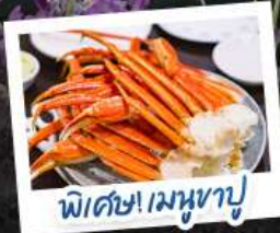
พิเศษ! เมฆหอบู