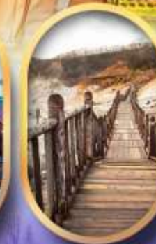
หุบเขาจิกุกดาบิ