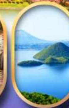
อิวากะเลสาบโทยะ