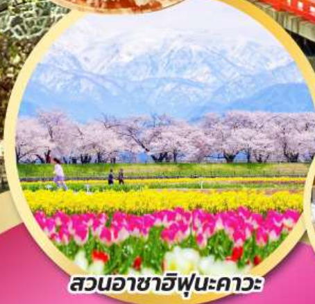
สวนอาซาฮิฟุเนะคาวะ