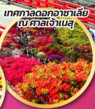
เทศกาลดอกอาซาเลีย ณ ศาลเจ้าเนสุ