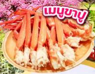
เมนูขาปู