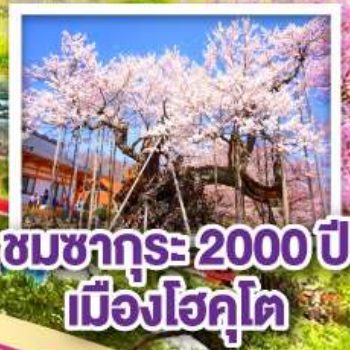
ชมซากุระ 2000 ปี เมืองโฮคุโต