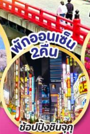
พักออนเซ็น 2 คืน