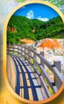
โนโบริเบทสึ