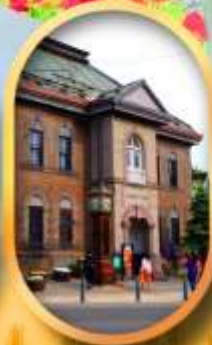
พิพิธภัณฑ์กล่องดนตรี