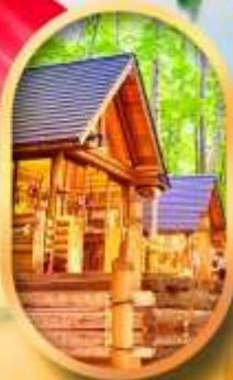
บึงเกิลเกอเฮส