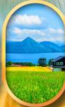
ทะเลสาบโทยะ