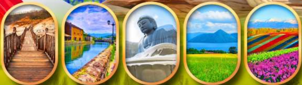
หุบเขาจิกุกดาบิ คลองโอดารุ เนินเขาแห่งพระพุทธรเจ้า ทะเลสาบโทยะ สวนดอกไม้ชิชิโซ

เที่ยวเต็ม ไม่มีฟรีเคย์ แวะพักเครื่องบิน 1 ชม.