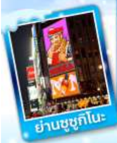
ย่านชูชุกิโนะ