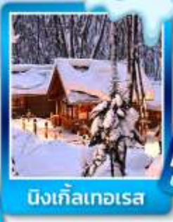
นิงเกิลเทอเรส