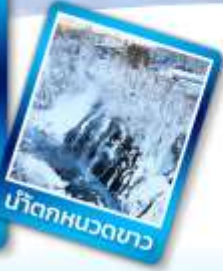
บิเอดททวดทว