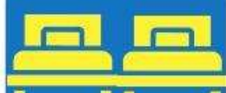
ห้องพักเตียงคู่ TWIN