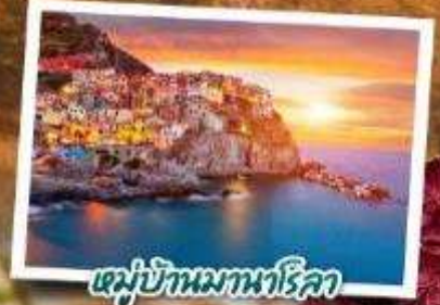
หมู่บ้านมหานาโรลา