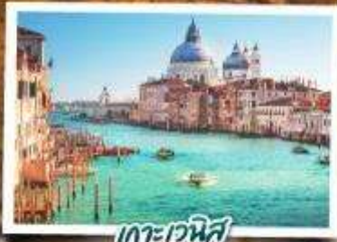
เกาะเวนิส