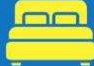
ห้องพักดับเบิล DOUBLE