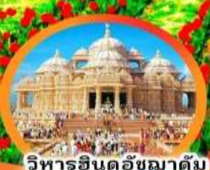
วิหารอินดูอัชมาตัม