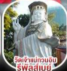
วัดเจ้าแม่กวนอิมรีพัลส์เบย์