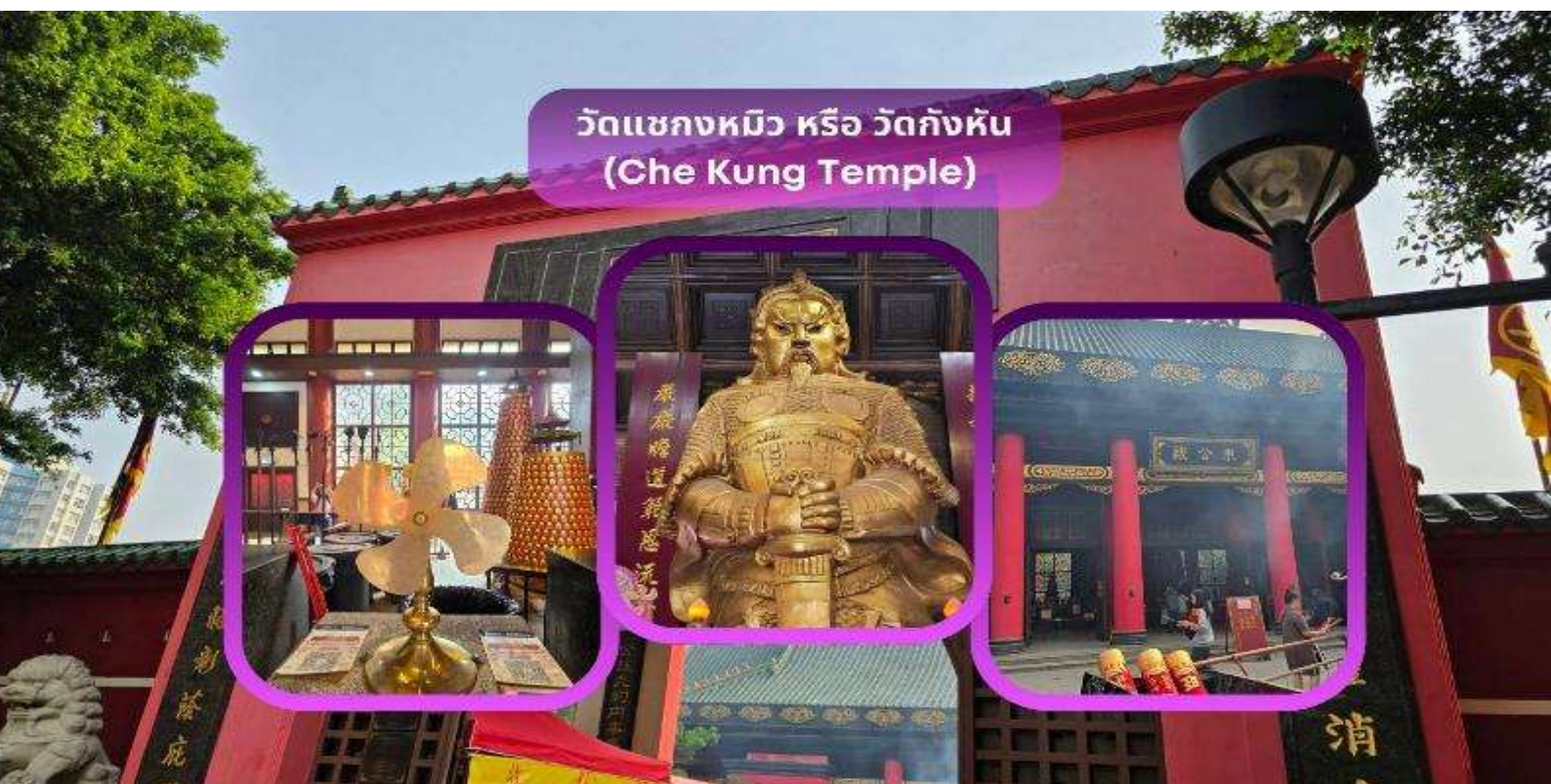
วัดแชกงหมิว หรือ วัดกังหัน (Che Kung Temple)

จากนั้นนำท่านชม ร้านหยก มีสินค้ามากมายเกี่ยวกับหยก อาทิ กำไลหยก หรือสัตว์นำโชคอย่างปี่เสีเยะ อีสระให้ได้ เลือกซื้อเป็นของฝาก หรือเป็นของที่ระลึกนำโชคแต่ตัวเอง