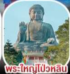
พระใหญ่ไผ่หลิน