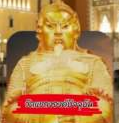
วัดพระทองอินทร์จตุร