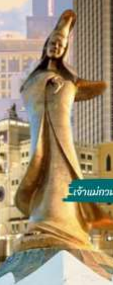
เจ้าแม่กวนอิม ริมทะเล