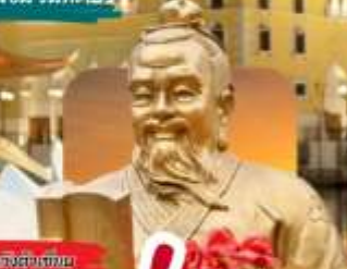
วัดซางฮงฮาม