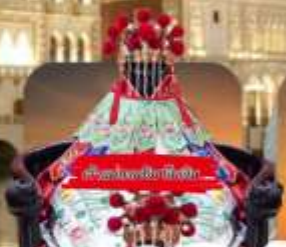
วัดพระทองอินทร์จตุร