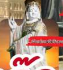
วัดพระทองอินทร์จตุร