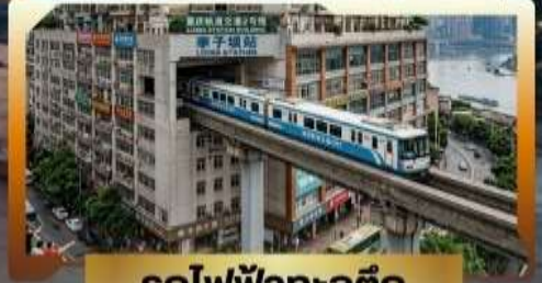
รถไฟฟ้ากะลุดัก