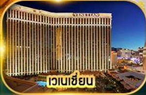
เวเนเซียน