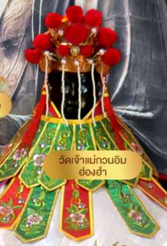
วัดเจ้าแม่กวนอิม ย่องฮ่า