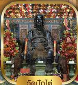
วัดปึกใต้