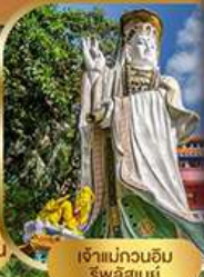
เจ้าแม่กวนอิม ธิวลิสมย์