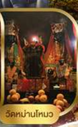
วัดนานโหมว