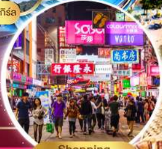
Shopping Tsim Sha Tsui