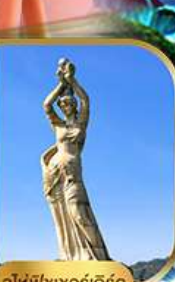
จูไห่ฟิชเชอร์ทิสรา