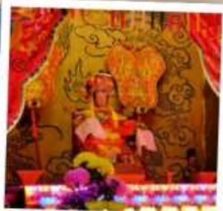
เจ้าแม่ทับทิม จอสเฮาส์เบย์