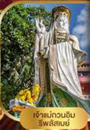
เจ้าแม่กวนอิม ริฟลิสซัน