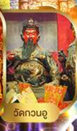
วัดกวนอู