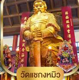
วัดแฉกงหมิว