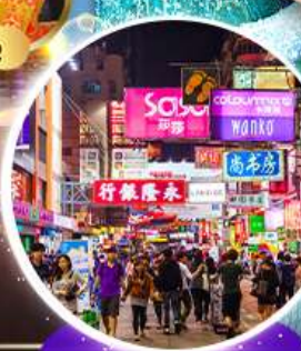
Shopping Taim Sha Tsui