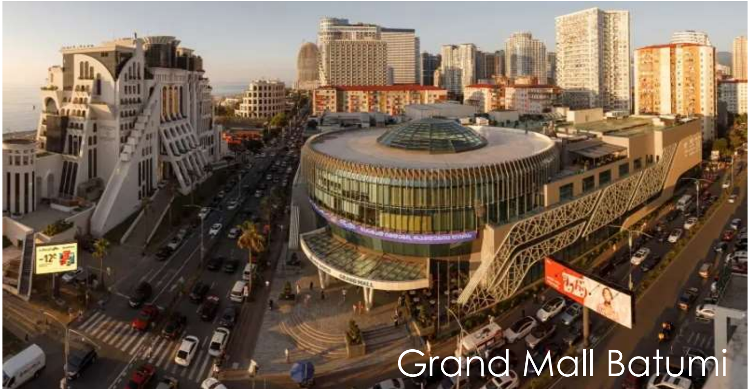
Grand Mall Batumi

ก่อนเดินทางกลับโรงแรม นำทุกท่านแวะช้อปปิ้งที่ Grand Mall Batumi ศูนย์การค้าขนาดใหญ่ของเมือง รวบรวมร้านค้าแบรนด์ดัง ร้านอาหาร และโซนบันเทิงมากมาย ก่อนให้ท่านได้อิสระช้อปปิ้งตามและรับประทานอาหารเช้าตามอัธยาศัย