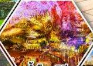
ถ้ำไฟรมีริอุส