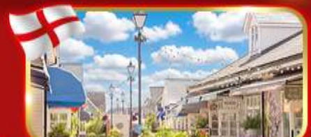
ช้อปปิ้งเอาท์เล็ต Bicester village