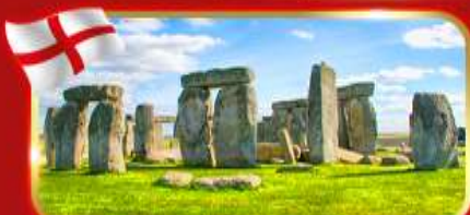
สโตนเฮนจ์ สิ่งมหัศจรรย์ของโลก