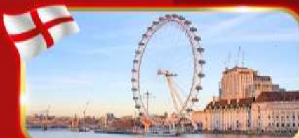
ชมวิวชิงช้าที่สูงที่สุดในยุโรป ลอนดอนอาย