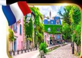
Rue de l'Abreuvoir มงมาร์ต