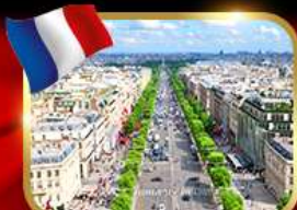
เดินเล่นย่านช็องเซลีซ