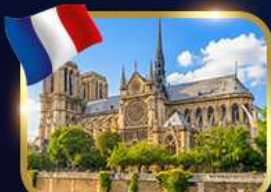
มหาวิหารนอร์เทอ์ดาม