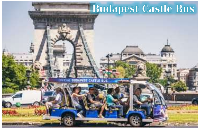
Budapest Castle Bus

บูดา Castle Hill *เนื่องจากตัวปราสาทตั้งอยู่บนเนินเขา การเดินทางโดยรถไฟไฟฟ้า จะเพิ่มความสะดวกสบายให้กับท่าน โดยรถไฟไฟฟ้าจะจอดรับและส่งตามจุดต่างๆ ในย่านเมืองเก่า ไม่ต้องเดินเท้าเป็นระยะทางไกล* จากนั้นนำท่านเดินชมความงดงามของเมืองเก่ารอบๆปราสาทบูดา ที่เริ่มมีการก่อสร้างมาตั้งแต่ปี ค.ศ.1265 และต่อเติมปรับปรุงมาโดยตลอด จนกระทั่งปัจจุบัน โดยตัวอาคารในปัจจุบันเราจะเห็นเป็นสไตล์บาโรค ที่ดู