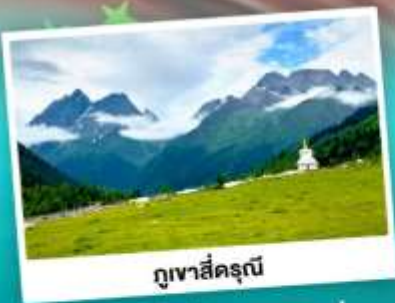
ภูเขาสิ่ครุณี

ชมความสวยงามทึ่งหน้าตาทง เทียวภูเขาสิ่ครุณี อุทยานย่ำตัง "แซงกรีกัวแซ่งกุดก่าง" S-คตบ 5A