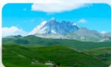
ทุ่งหญ้าด่าง