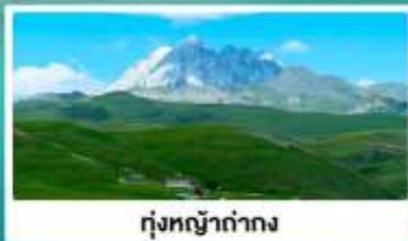
ทุ่งหญ้าดำทง