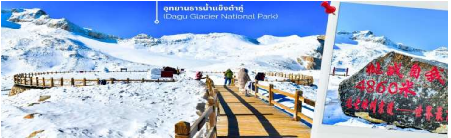
การตกและความหนาวของหิมะขึ้นอยู่กับสภาพอากาศ

จากนั้นนำท่านเดินทางสู่ เมืองเฮยฮุย (ใช้เวลาเดินทางประมาณ 2 ชั่วโมง)เพื่อเดินทางไปยัง อุทยานธารน้ำแข็งต้ากู่ปิงชว่น(รวมกระเช้าขึ้นลง) ต้ากู่ปิงชว่น หรือ Dagu Glacier National Park เป็นธารน้ำแข็งกลางเขี้ยวที่สวยงามที่สุดแห่งหนึ่งของโลก และเป็นสถานที่ท่องเที่ยวระดับ 4A ของจีน ตั้งอยู่ที่เมืองเฮยฮุย ในมณฑลเสฉวน ห่างจากเมืองเฉิงตูประมาณ 300 กิโลเมตร ถือเป็นธารน้ำแข็งที่อายุน้อยที่สุด ที่ตั้งอยู่ในระดับความสูงที่ต่ำที่สุด และอยู่ใกล้กับเมืองมากที่สุดในบรรดาธารน้ำแข็งทั้งหมด โดยอยู่สูงจากระดับน้ำทะเลประมาณ 3,800-5,100 เมตร จุดสูงที่สุดที่นักท่องเที่ยวสามารถขึ้นไปได้จะอยู่ที่ 4,860 เมตร