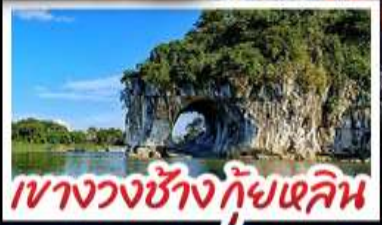
เขางวงช้าง กุ้ยหลิน