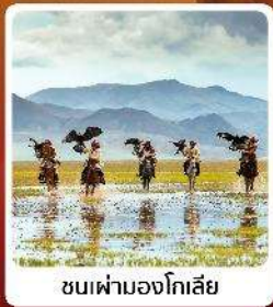
ชนเผ่ามองโกเลีย