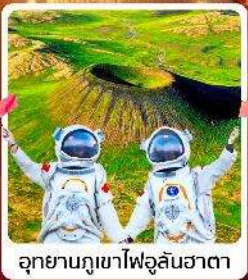
อุทยานภูเขาไฟอูลันฮาตา