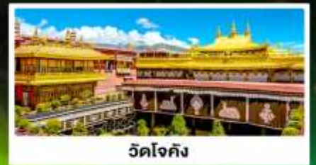
วัดโจกิง