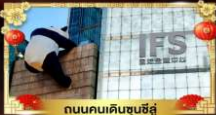
ถนนคนเดินชุนชี่อู๋

เที่ยวอุทยานสวรรค์ระดับ 5A จิวจ้ายโกว "ภูเขาสี่ดรุณี" อุทยานชื่อดังเหนียงชาน