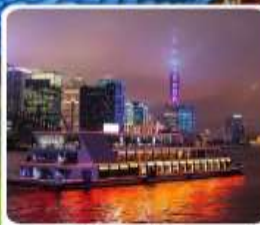
ส่องเรือแม่น้ำหวงผู่