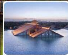
พิพิธภัณฑ์ไดน้ำ กวางฟู่หลิน