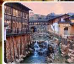
เมืองโบราณเหย้าหู