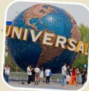
5 UNIVERSAL BEIJING