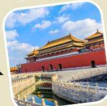
3 พระราชวังต้องห้าม