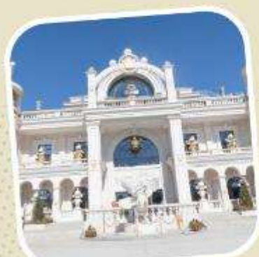
6 POP LAND