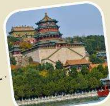
4 พระราชวังฤดูร้อน