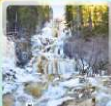
น้ำตกธารไถ่บูก