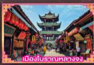
เมืองโบราณกลางจง