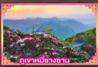
ภูเขาที่มีนางชาน