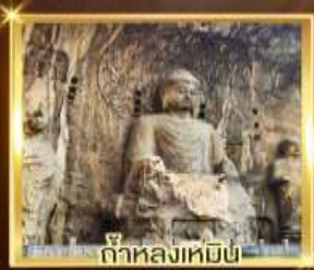
ถ้ำหลงเหมิน