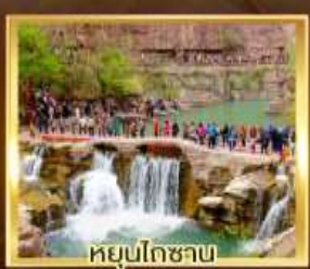
หยุ่นโกซ่าน