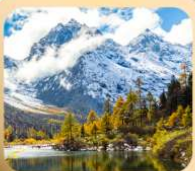
“ปี่ผิงโกว”

ชมธรรมชาติ 2 อุทยานขึ้นชื่อ อุทยานภูเขาสี่ดรุณี + อุทยานปี่ผิงโกว สะพานหนานเฉียว • ถนนคนเดินไถ่กู่หลี่ + ซุนซีลู่ + Pop Mart • ดงเจียวจื่อ