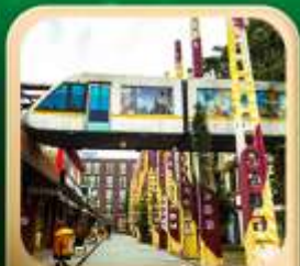
“ดงเจียวจื่อ”