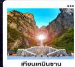
เกียนหมินซาน