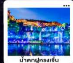
น้ำตกฝูหลงเจิน

"มหัศจรรย์...จางเจียเจีย" | ดินแดนแห่งขุนเขาและสายน้ำ "เขาเกียนหมินซาน" | ประตูสวรรค์...ทำกายศรึกษา 999 ชั้น | บั้งรถไฟความเร็วสูง สัมผัสความสวยงามระเบียบแกว "อุทยานอวตาร" | ส่องลอยกลางขุนเขา...ดั่งภาพฝันในห้วงนเจียเจีย | ช้อปปิ้ง POPMART "เมืองโบราณ" ฝูหลง" หยุตเวลา ณ เมืองบนม่านน้ำตก... | "เฟิ่งหวง" ส่องเรือชมชีวิตริมแม่น้ำถิวเจียง "นครฉางซา" ปิดท้ายความทันสมัย