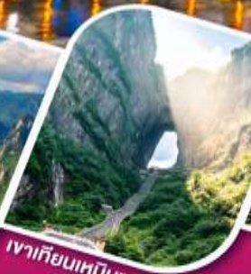
เขากิ๊ยนหมินซาน