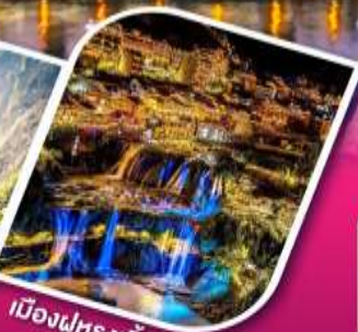
เมืองฝูหลงจิ้น