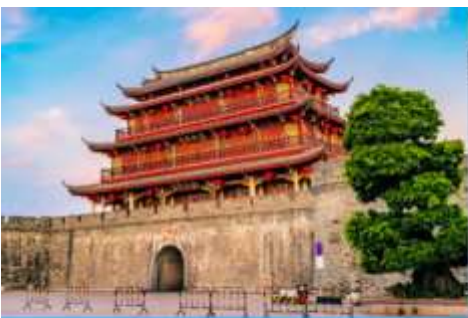
เมืองโบราณเต๋อจิว

พักที่ โรงแรม HAKKA TULOU PRINCE HOTEL 4* หรือเทียบเท่าในเมืองหย่งตั้ง