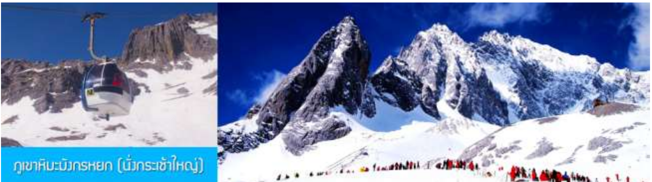
ภูเขาหิมะมังกรหยก (เขื่อนกระซำใหญ่)

พักที่ FENGHUNG YANGSHENG HOTEL ระดับ 4 ดาวที่ถิ่งถินหรือเทียบเท่าใน เมืองลี่เจียง