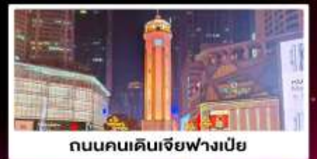
ถนนคนเดินเจี๋ยฟางเป่ย์