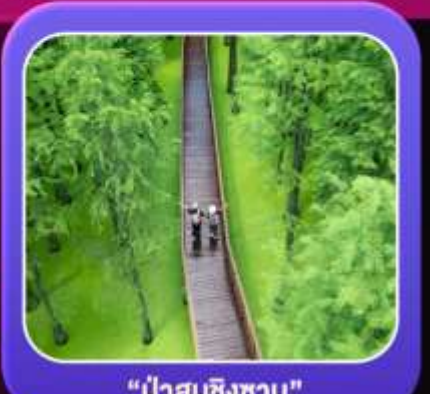
"ป่าสนชิงซาน"