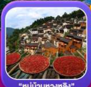
"หมู่บ้านทองหลิง"

หุบเขาเทวดาฉงเซี่ยนถู่ หมู่บ้านที่ตั้งอยู่ริมหน้าผา • หมู่บ้านโบราณทองหลิง ป่าสนน้ำชิงซาน • ล่องเรือทะเลสาบซีหู • ถนนโบราณตุ๋นจ้อ • ชมแสงสีที่ อุ๋นนี่โจว