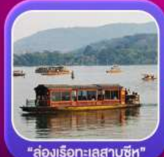
"ล่องเรือทะเลสาบซีหู"