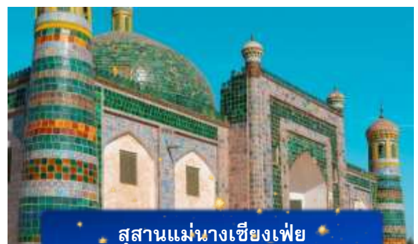
สุสานแม่นางเชียงเพียว

ที่พัก FENGWUQI HOTEL เทียบเท่าหรือระดับ 3 ดาวท้องถิ่น