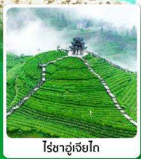
ไร่ชาอู่เจียโก