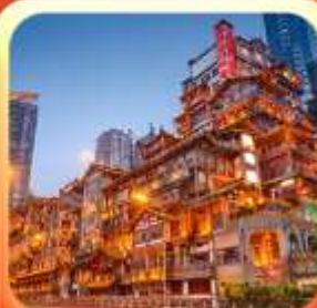
"ล่องเรือชมวิวหงหยาดัง"