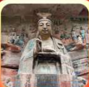
"ผาหินแกะสลักต้าจู้"