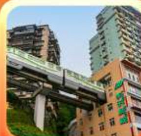
"นั้รงรถไฟทะลุคิก"