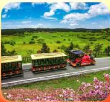
"อุทยานเขานางฟ้า"

บินตรงลงชิง • อยู่หลง หลุมฟ้าสะพานสวรรค์ • ระเบิดยงแกว • อุทยานเขานางฟ้า หงหยาดัง • นั้รงรถไฟทะลุคิก • ล่องเรือชมฉงฉิงยามค่ำคืน • ศาลาประชาคม (ด้านนอก) มรดกโลกผาหินแกะสลักต้าจู้ • เมืองโบราณสี่ปาตี้ • วัดหลิวฮั่น • ตักตะเกียบ