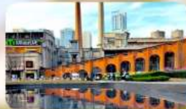
ตงเจียวจื่ออี้