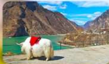
กะเลสาบเต๋อซี