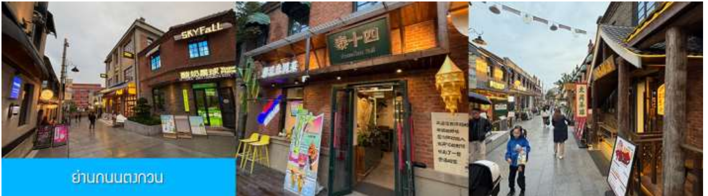
ย่านถนนตวงวอน

หลังอาหารนำท่านเที่ยวชม จัตุรัสชิงไห่ 星海广场 เป็นจัตุรัสขนาดใหญ่เป็นแลนด์มาร์คสำคัญของเมืองต้าเหลียน สร้างขึ้นเพื่อเฉลิมฉลองในโอกาสที่รัฐบาลอังกฤษคืนเกาะฮ่องกงในให้จีนในปี ค.ศ. 1997 ตั้งอยู่ชายฝั่งทะเลในเมืองต้าเหลียน เป็นจัตุรัสใจกลางเมืองที่ใหญ่ที่สุดในโลกและเป็นแลนด์มาร์คของเมืองต้าเหลียน รายล้อมด้วยตึกระฟ้าที่ทันสมัย ภายในมีบ่อน้ำพุดนตรี ลานหญ้าขนาดใหญ่ และลานกว้างสำหรับจัดกิจกรรมกลางแจ้ง อาทิ เทศกาลเบียร์นานาชาติ การแข่งขันวิ่งมาราธอน งานแฟชั่นนานาชาติเมืองต้าเหลียน ฯลฯ