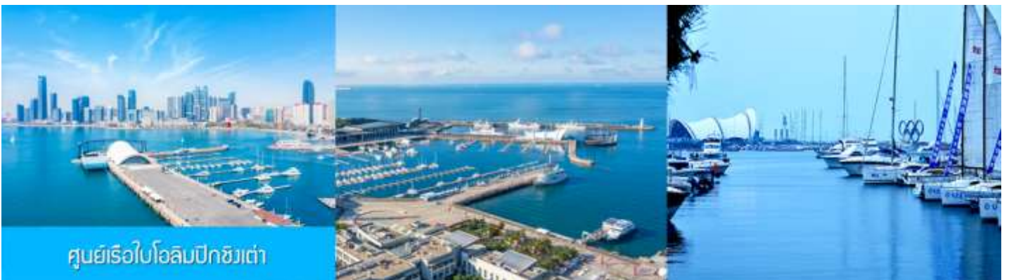
ศูนย์เรือใบโอลิมปิกชิงเต่า

จากนั้นนำท่านเที่ยวชม โรงเบียร์ชิงเต่า 青岛啤酒博物馆 พิพิธภัณฑ์เบียร์ที่ขึ้นชื่อของเมืองชิงเต่า ซึ่งเป็นเบียร์ยี่ห้อแรกที่ผลิตขึ้นในประเทศจีน ชมเบียร์ คอลเลกชันที่มียี่ห้อหลากหลายที่สุดของโลก และชมการจัดแสดงภาพและวิทัศน์เกี่ยวกับวิวัฒนาการของเบียร์ ขั้นตอนการผลิตและอื่น ๆ ที่เกี่ยวข้อง พร้อมชิมเบียร์ชิงเต่า ซึ่งเป็นเบียร์ที่ขายดีที่สุดยี่ห้อหนึ่งของจีน.. (ชิมเบียร์ชิงเต่าท่านละ 1 แก้ว รับกลับอีก 1 ขวดเล็ก ตอนเดินออก)