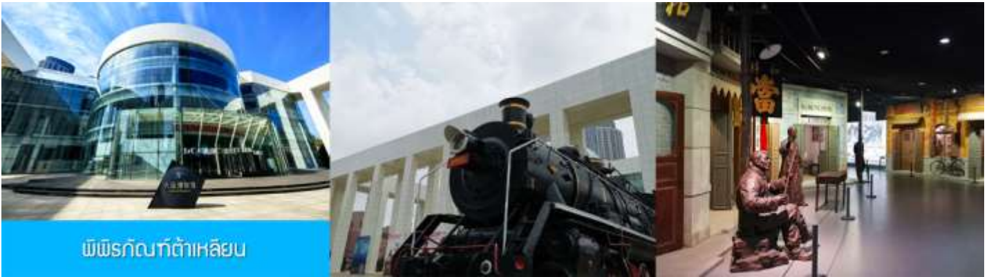
พิพิธภัณฑ์ต้าเหลียน

เช้า รับประทานอาหารเช้า ห้องอาหารของโรงแรม (13)