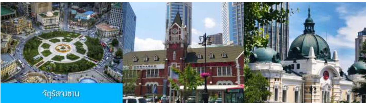
จัตุรัสสวน