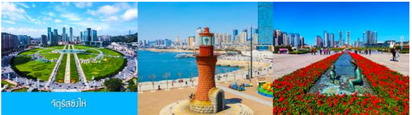
จัตุรัส星海

จากนั้นนำท่านเที่ยวชมและเก็บภาพ พิพิธภัณฑ์ประวัติศาสตร์หลู่ซุ่น 旅顺博物馆 เป็นอาคารพิพิธภัณฑ์เก่าแก่อายุกว่าร้อยปีแห่งแรกที่สร้างขึ้นทางภาคตะวันออกเฉียงเหนือของจีน อาคารพิพิธภัณฑ์มีความโดดเด่นด้วยสถาปัตยกรรมแบบกรีกโรมันยุคเรเนสซองส์ ผสมผสานสถาปัตยกรรมแบบตะวันตกออก ภายในมีการจัดแสดงโบราณวัตถุกว่า 60,000 ชิ้น ท่านสามารถเก็บภาพที่ระลึกด้านหน้าอาคารพิพิธภัณฑ์ และสามารถเข้าชมโบราณวัตถุภายในพิพิธภัณฑ์ได้ตามอัธยาศัย (พิพิธภัณฑ์ปิดทุกวันจันทร์)..