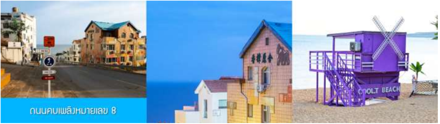
ถนนคบเพลิงหมายเลข 8

จากนั้นนำท่านเก็บรูปกับ ถนนคบเพลิงหมายเลข 8 火炬八街 มุมสุดฮิตที่ต้องมาเก็บรูป เป็นถนนสายเล็ก ๆ ที่ทอดยาวสุดตา เหมือนกับว่าบรรจบกลับเส้นขอบฟ้า เป็นจุดที่นักท่องเที่ยวต้องมาเก็บภาพบรรยากาศ เพราะฮิตที่สุดของเมืองเว่ยไห่แล้วตอนนี้ ให้ท่านได้เก็บภาพ และนั่งชิลคาเฟ่ ตามอัธยาศัย..... จากนั้นนำท่านเดินทางสู่ เมืองเยียนไถ 烟台 (ระยะทาง 72 กม. ใช้เวลาเดินทางราว 1 ชั่วโมง)