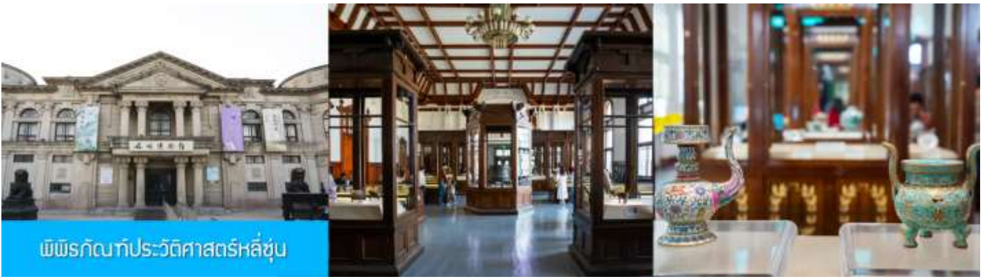
พิพิธภัณฑ์ประวัติศาสตร์หลู่ซุ่น

จากนั้นนำท่านเที่ยวชมและเก็บภาพ พิพิธภัณฑ์ประวัติศาสตร์หลู่ซุ่น 旅顺博物馆 เป็นอาคารพิพิธภัณฑ์เก่าแก่อายุกว่าร้อยปีแห่งแรกที่สร้างขึ้นทางภาคตะวันออกเฉียงเหนือของจีน อาคารพิพิธภัณฑ์มีความโดดเด่นด้วยสถาปัตยกรรมแบบกรีกโรมันยุคเรเนสซองส์ ผสมผสานสถาปัตยกรรมแบบตะวันตกออก ภายในมีการจัดแสดงโบราณวัตถุกว่า 60,000 ชิ้น ท่านสามารถเก็บภาพที่ระลึกด้านหน้าอาคารพิพิธภัณฑ์ และสามารถเข้าชมโบราณวัตถุภายในพิพิธภัณฑ์ได้ตามอัธยาศัย (พิพิธภัณฑ์ปิดทุกวันจันทร์)..