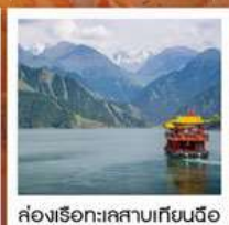
คลองเรือทะเลสาบเทียนฉือ