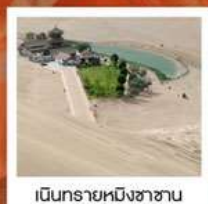
เขื่อนทรายหมิงซาซาน