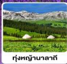
ทุ่งหญ้านาลาตี