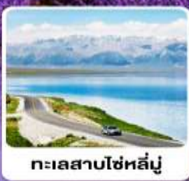
ทะเลสาบไซห์หลินู๋