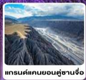
แกรนด์แคนยอนตูซานจื่อ