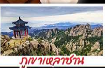
ภูเขาเหลาชาน