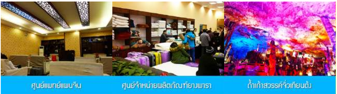
ศูนย์แพทย์แผนจีน

อัตราค่าบริการสำหรับโปรแกรมเสริมการแสดงชุด The love Story of Wooden man and Fairy Fox ท่านละ 400 หยวน (หรือประมาณ 2000.-บาทขึ้นอยู่กับอัตราแลกเปลี่ยน) ระยะเวลาที่ใช้ในการเที่ยวชมการแสดง ประมาณ 3 ชั่วโมง รวมเวลา เดินทางไป กลับค่าบริการรวม ค่าบัตรเข้าชม ค่ารถรับ ส่ง และค่าน้ำดื่มของไกด์ท้องถิ่น