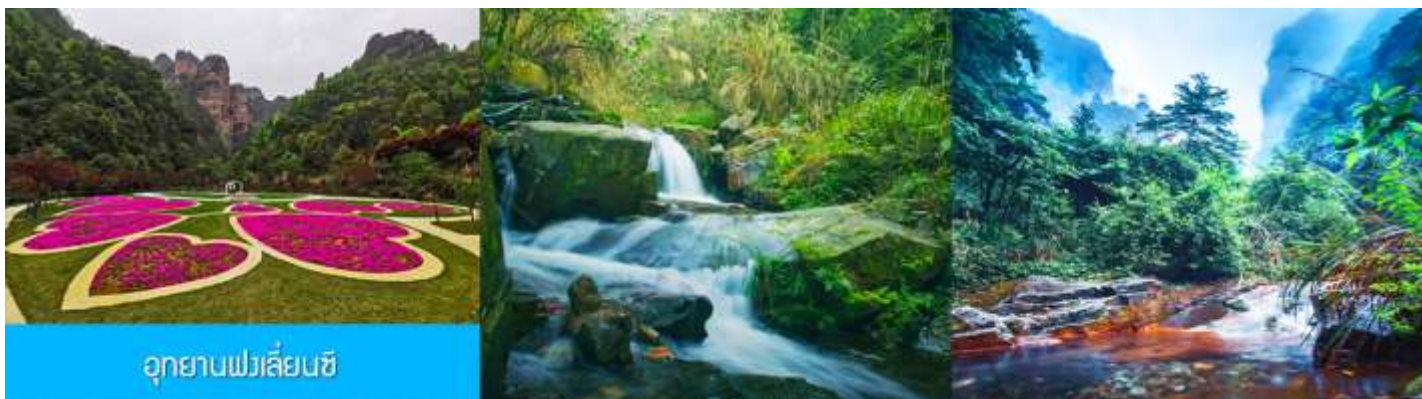
อุทยานฟงเลียนซี