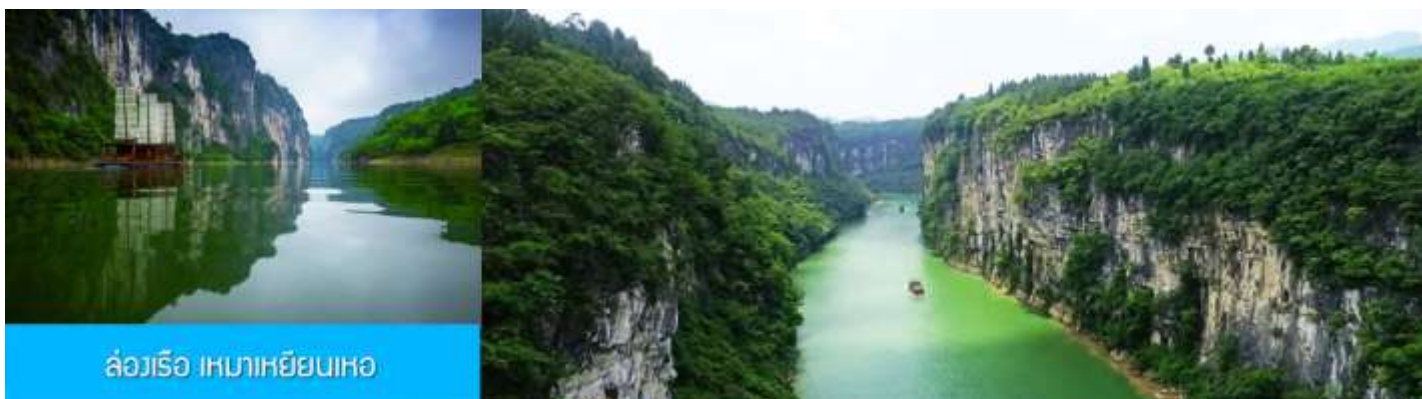
ล่องเรือ เหมาเหยียนเหอ