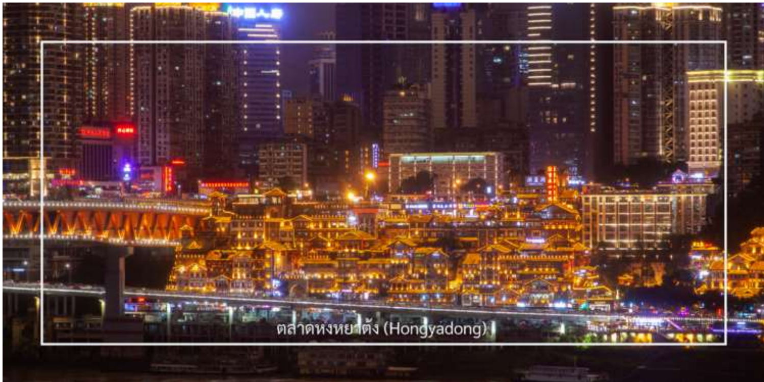
ตลาดหงหยาดัง (Hongyadong)

จากนั้นเดินทางไปยัง ตลาดหงหยาดัง (Hongyadong) หรือที่เรียกว่า "Hongya Cave" เป็นสถานที่ท่องเที่ยวที่มีชื่อเสียงในเมืองฉงชิ่ง โดยตั้งอยู่ริมแม่น้ำแยงซี มีบรรยากาศที่เต็มไปด้วยวัฒนธรรมและประวัติศาสตร์ ตลาดหงหยาดัง เป็นพื้นที่ที่มีอาคารแบบดั้งเดิมที่สร้างขึ้นในสไตล์สถาปัตยกรรมแบบชิโน-ทิเบต โดยมีร้านค้า ร้านอาหาร และบาร์จำนวนมาก ที่นี่คุณสามารถลิ้มลองอาหารท้องถิ่นที่อร่อย เช่น ฮอทพอทฉงชิ่ง (Chongqing Hot Pot) และขนมพื้นเมืองอื่นๆ นอกจากนี้ ตลาดหงหยาดังยังมีวิวทิวทัศน์ที่สวยงาม โดยเฉพาะในช่วงเย็นเมื่อไฟประดับส่องสว่าง ที่ทำให้บรรยากาศมีความโรแมนติกและน่าตื่นตาตื่นใจ คุณสามารถเดินเล่นตามทางเดินที่มีการจัดแสดงงานศิลปะและสินค้าท้องถิ่น